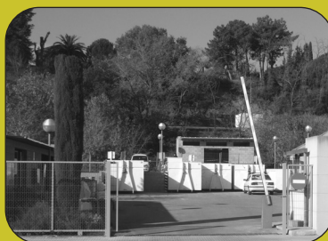
Polígon industrial Congost C/ Joan Brossa Tel. 937 445 098

Recordeu que els usuaris habituals de la deixalleria tenen dret a una bonificació del 15% o 30% de la taxa d'escombraries un cop acreditin l'obtenció de 15 punts amb 3 fraccions diferents o 30 punts amb 6 fraccions diferents amb la nova targeta amb codi de barres.